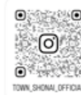
【公式】山形県庄内町

こちらの3つのアカウントでは、町のイベントや施設の情報、行われた事業をタイムリーに紹介しています。