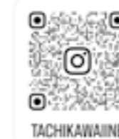
庄内町立川地域振興係