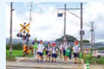
△仲良く歩く二小の子ども達

ながら最後まで一緒に歩ききり、ついにゴールします。本校の目指す「思いやりをもち、かわり、行動できる子ども」の姿がそこにあります。学校だからこそできるこうした体験活動を今後も大切にしていきたいです。