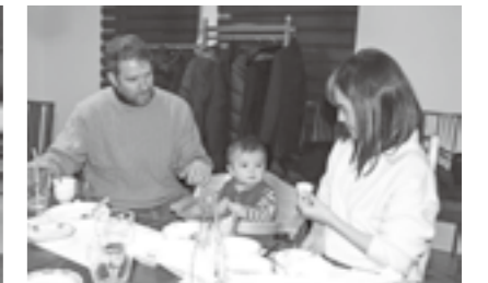
▲体験後、郷土料理を楽しみました