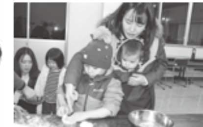
▲つきたてのお餅で丸餅作り