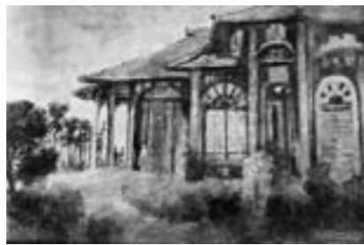
内藤秀因「蘭人邸」(グラバー邸)