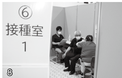
▲ワクチン接種。原則として、利き腕と反対の腕に接種します。(接種日の飲酒はできません)