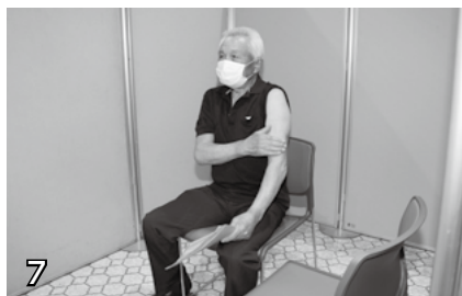
▲接種前準備(肩だし)。上腕に接種します。肩を出せる服装でおいでください。