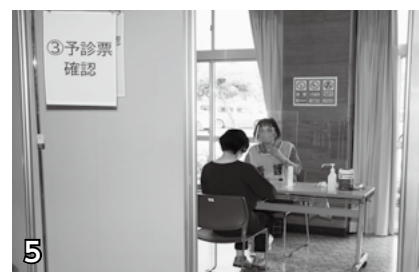
▲予診票確認。記入漏れや、記入内容の確認を行います。37.5度以上の熱があるときは接種できません。