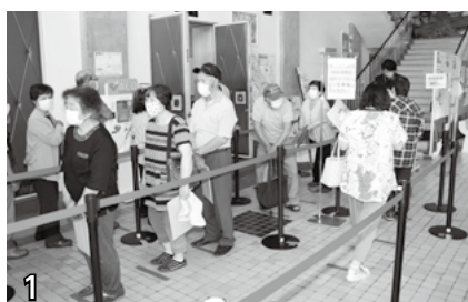
▲予約時間になると案内します。整列の上準備をお願いします。(予約時間にならないと入場できません)