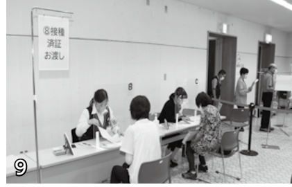
▲接種済証発行場所。新型コロナワクチンの接種済証を発行します。接種済証は大切に保管してください。