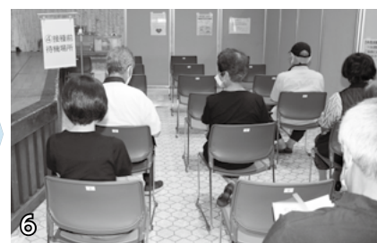
▲接種前待機場所。心を落ち着けて接種を待ちましょう。