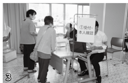
▲受付・本人確認。予防接種券・本人確認用の身分証明書(運転免許証、健康保険証、マイナンバーカード等)で本人確認します。