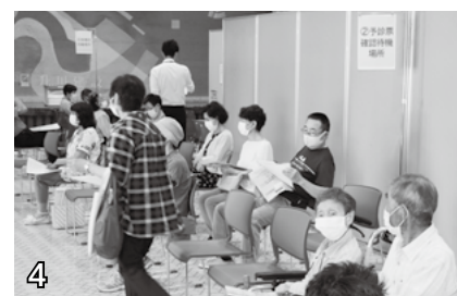
▲予診票確認待機場所。予診票の確認で番号を呼ばれるまで、こちらでお待ちください。