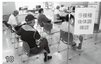
▲接種後体調確認。15分~30分程度安静にして、アナフィラキシー症状や副反応がないか様子を見ます。

ワクチン接種終了！お疲れ様でした。2回目も忘れずにおいでください。予約をキャンセルする場合は、必ずコールセンターに連絡をお願いします。 ☎0120-414-170 ※最終受付時間は15時45分です。必ず時間内においでください。