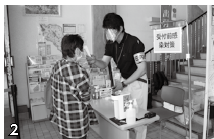
▲受付前感染対策。検温、手指消毒を行います。(必ずマスクを着用してください)