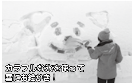
カラフルな氷を使って雪にお絵かき!