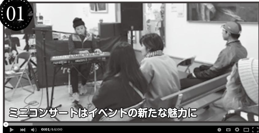
ミニコンサートはイベントの新たな魅力に