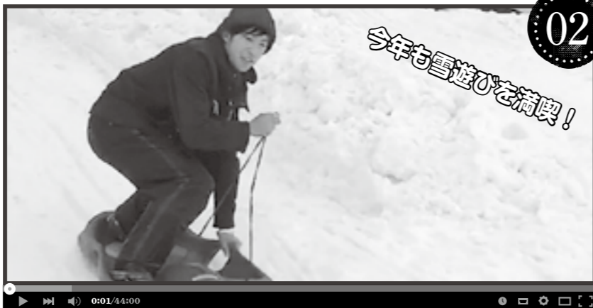
今年も雪遊びを満喫!

雪が本格的に降り始め、北月山荘ではおもいっきり雪遊びを楽しめます。昨年と同様、童心に戻って雪国を満喫しています。