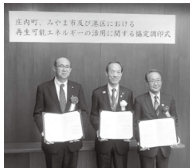
▲ (左から) 庄内町、港区、みやま市

東京都港区は、再生可能エネルギーを算出する自治体と連携して地球温暖化防止に取り組んでいます。福岡県みやま市などが設立した小売電気事業者みやまスマートエネルギー株式会社を通じて、平成31年度を目途に、本町の町営風力発電所で産出される電気を、港区の公共施設へ供給することを目指します。