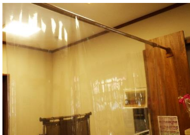
入口カウンターの透明ビニール