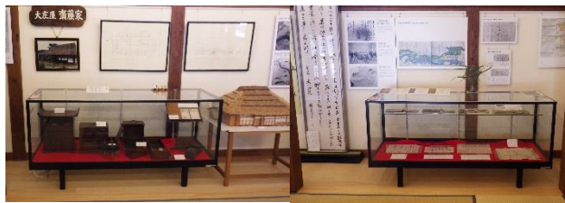
清川大庄屋小道具展示

清川歴史公園管理運営委員会では、食堂・売店・ガイドなどにご協力いただける方、一緒に地域を盛り上げていただける方を募集しています。委員の方または役場立川総合支所立川地域振興係までお気軽にお声がけください。 連絡先 〇二三四五六〇二二一三