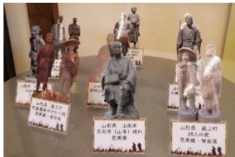
芭蕉像ミニパネル