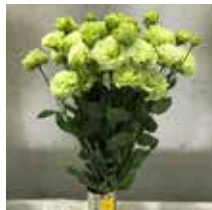
↑栽培した花がフラワーショーに出展されていました!!