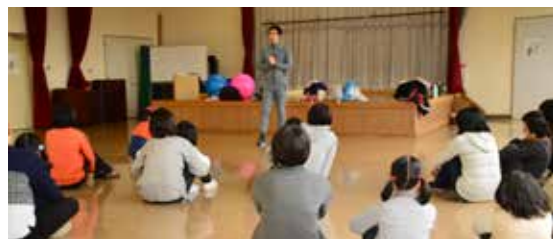
↑親子運動教室のようす↑