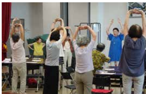
老若男女問わず、音楽を通して交流しています♪