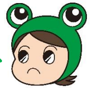
県消費生活センター キャラクター 消費者教育推進大使 “ケロちゃん”

ケロちゃん：年末になると、カニや海産物などの購入を勧める電話が増えるケロ！中には強引に契約を迫り、「断ったのに品物が届いた」という相談も寄せられているケロ！ トラブルにあう人のほとんどが高齢者だケロ！