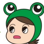
県消費生活センター キャラクター “ケロちゃん”

ケロちゃん：ちょっと待ってケロ！便利な反面、「代金を支払ったのに商品が届かない」「電話しても連絡がつかない」などトラブルも多いケロ！ ポチッとクリックする前に、もう一度よく確認してケロ！