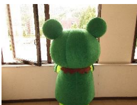
換気は大事だケロ

https://www.pref.yamagata.jp/ou/bosai/021006/kerochan/