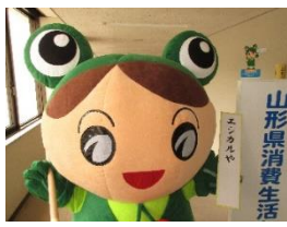
マイブームは川柳…