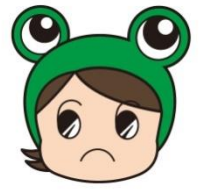
県消費生活センターキャラクター 消費者教育推進大使 “ケロちゃん”

ケロちゃん ：料金の安さだけで決めてはダメだケロ！あこがれの美容医療でも思いのほか料金が高額になったり、施術後の痛みややけどなどのトラブルも報告されているケロ！