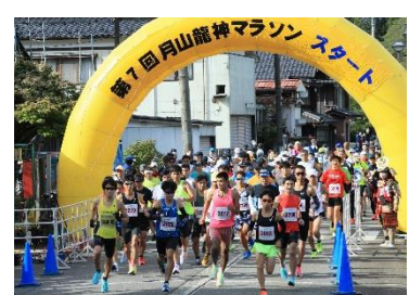
毎年10月上旬 月山龍神マラソン