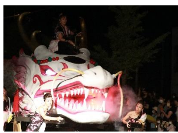
毎年8月11日 しょうない氣龍祭