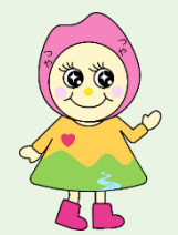
観光協会キャラクター つや美ちゃん