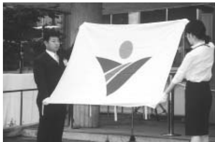
新しい町旗も披露

ました。一般会計には、光ファイバーを活用した地域公共ネットワーク整備事業（3億4千万円）を盛り込みました。