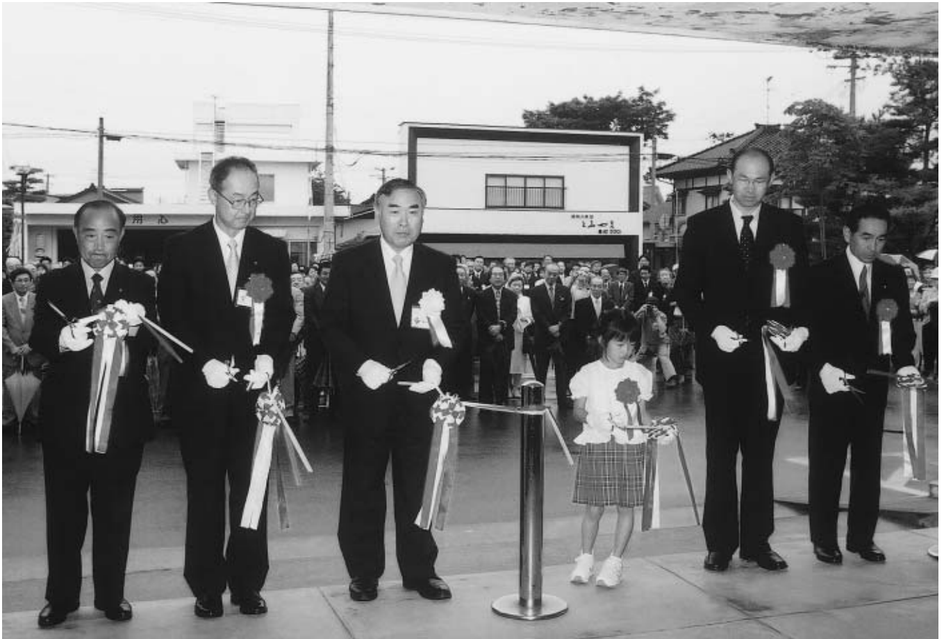
期待を込めて庄内町いよいよスタート

7月7日の初臨時会において、不肖、私が初代議長の重責を担うことになりました。大変光栄に思うとともに、身の引き締る思いです。議会の使命は、町の具体的な政策を最終的に決定すること。議会が決定した政策を執行部が適正、公平、効率に行われているかを監視すること。そして、未来への政策提言です。議員は町全体の代表ですが、多方面の意見に耳を傾け、激動する社会や、経済情勢の中で的確な対応を行わなくてはなりません。