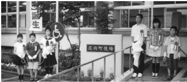
銘板の除幕を終えてニッコリ