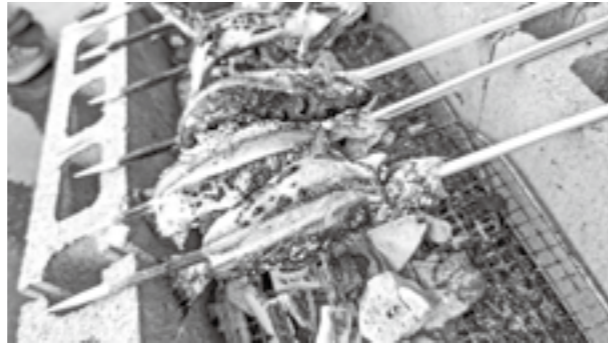
※塩焼きのガッサーモン