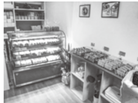
▲美味しそうなケーキが並ぶ店内