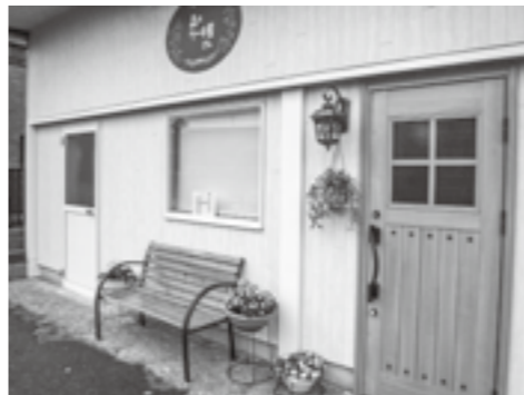
▲特にこだわったというお洒落なドア

いろいろな種類の焼き菓子を作ったり、夏に向けて柑橘系の新商品を出したいです。 お店を始めたことと違っていた以上に反響があり、県内各地から沢山のお客さんに来ていただけて驚いています。少しでも多くの方に提供できるように、これからも頑張りたいと思います。