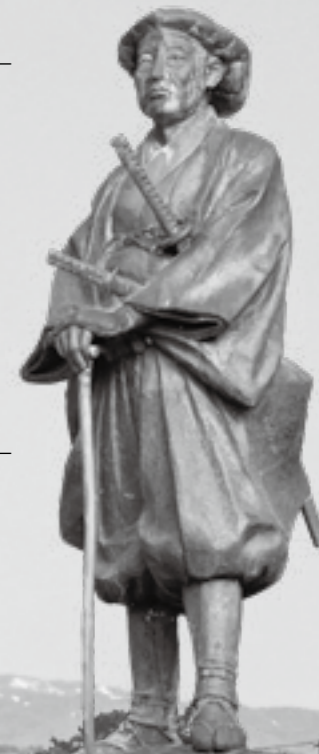
北館大学助利長公

約 四百年前、最上義光の命を受けた北館大学助利長が、北楯大堰開削工事を行ったことをきっかけに約5,000ヘクタールの新田と、88もの村が開かれ、庄内町の礎が築かれました。まさに本町はこの新規開田により誕生した町と言っても過言ではありません。