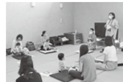
▲自身の子育ての経験を活かし「ベビーマッサージ教室 in 町湯」を開催

退任後はこれまでの経験を活かして、主に企業向けのマーケティングやPR支援の仕事をしていきます。引き続き庄内町におりますので、何かの際はお気軽にお声掛けいただけたら嬉しいです。今後とも末長くよろしく願います。