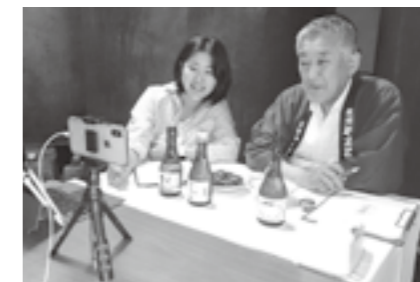
▲コロナ禍での新しい取組み 全国の人とつながるオンラインツアー