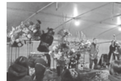
▲大盛況の「フラワーコンサート in the ビニールハウス」