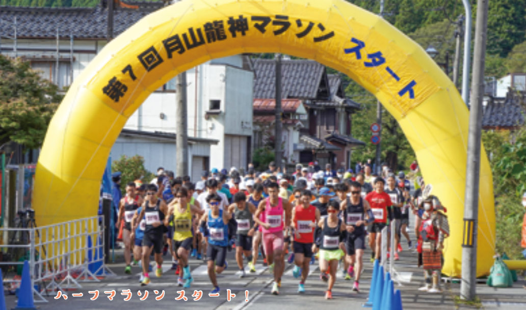
ハーフマラソン スタート!