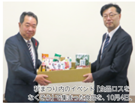
秋まつり内のイベント「食品ロスをなくそう」で集まった食品を、10月4日、町社会福祉協議会に寄贈しました。