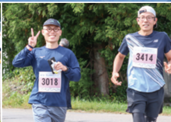
清川河川 グラウンド周辺