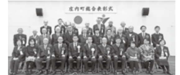
▲令和3年度総合表彰式の様子