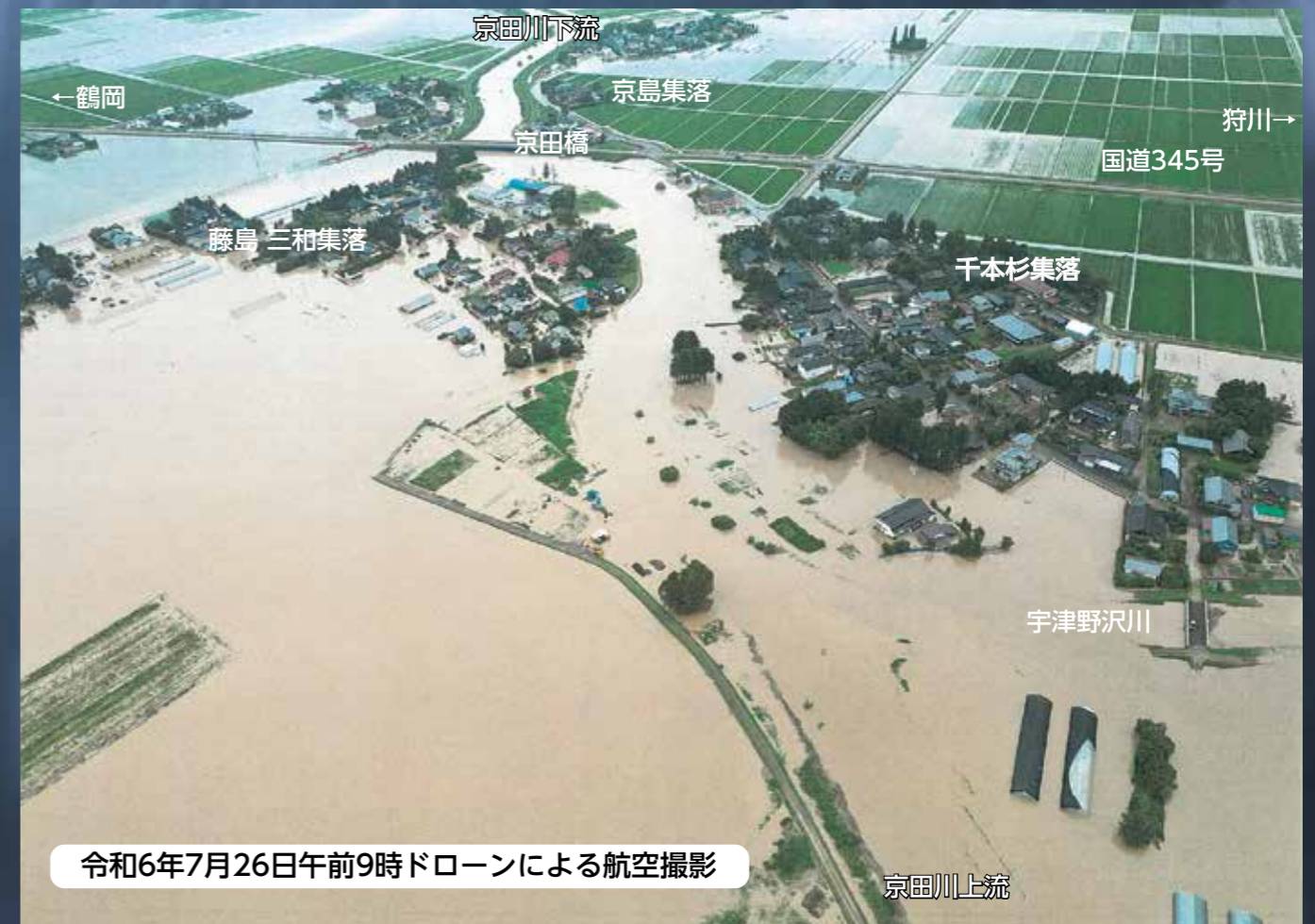
令和6年7月26日午前9時ドローンによる航空撮影