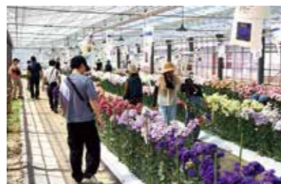
▲トルコギキョウフェスティバル

みなさんにきれいな花を届けるため、丹精込めて育てています。ぜひご家庭でもお楽しみください。