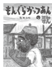
『もんぐらかつあんの歌』

ヒトは、互いにわかりあいたいという気持ちを深めることで、この世界を生きるのびてきた。そんな気持ちを大事にすれば、もっと平和な世界がつかれるはずだ。世界的な霊長類学者がこどもたちに贈る希望のメッセージ。