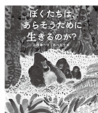
『ぼくたちは、あらそうために生きるのか?』

25年前、平穏だったはずの地方都市は、百貨店受付嬢誘拐殺人事件の発生、その報道により揺り動かされ、「噂」という大量の炎が、加害者のみならず被害者にも降り注ぎ…。