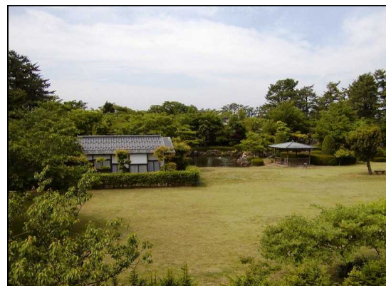
「八幡公園(庭園、茶室菁莪庵)」