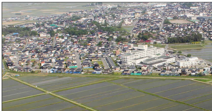
「松陽ニュータウン宅地開発」