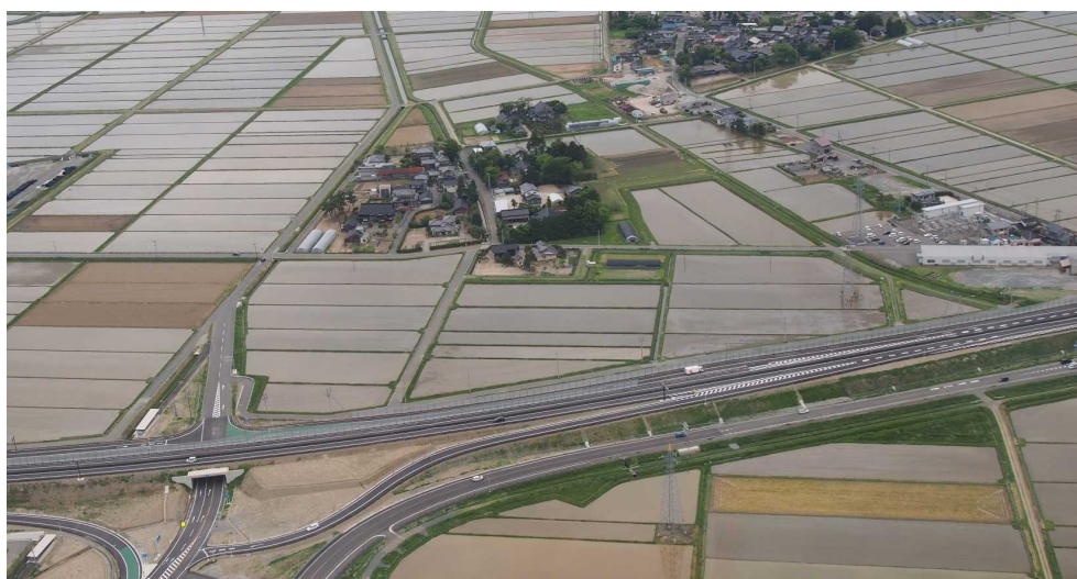
自動車専用道路「酒田余目線」