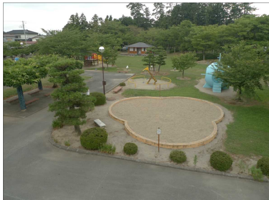
「八幡公園(遊具広場)」