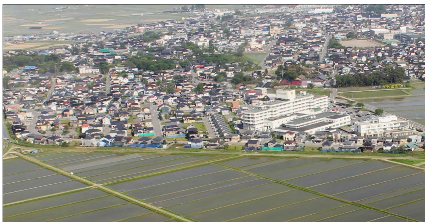
「松陽ニュータウン宅地開発」