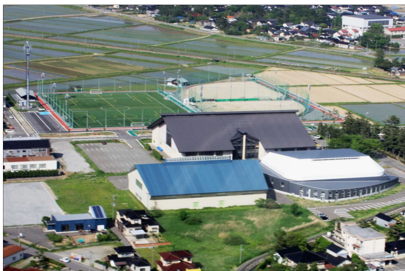
「八幡スポーツ公園開発」