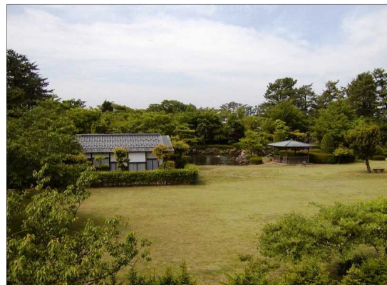
「八幡公園(庭園、茶室菁莪庵)」