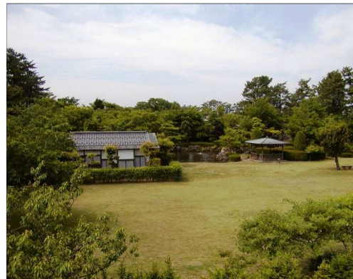
「八幡公園(庭園、茶室菁菴)」