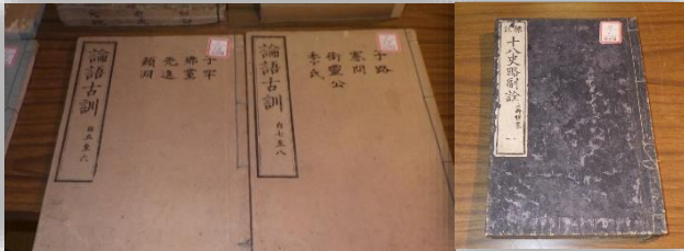
大庄屋から町に寄贈された書物12点を展示します

三つ目は、昔の清川の写真・絵画を拡大したパネル(写真下段左中)、歴史民俗資料館にある大庄屋より町に寄贈された書物(写真上段左)、大庄屋の襖絵(写真下段右)、旧御茶屋の図面等を展示します。