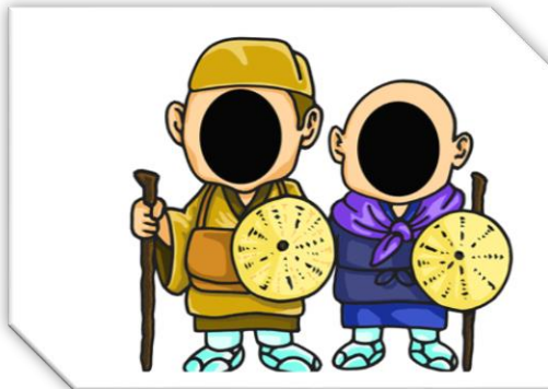
芭蕉と曾良(室外用)