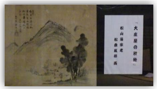
大庄屋の襖絵 松山藩家老 松森胤保画