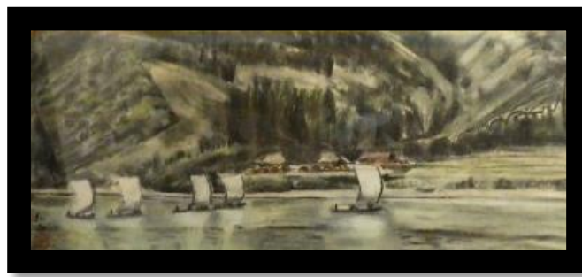
水彩画(複製) 齋藤弘氏筆 歎喜寺所蔵