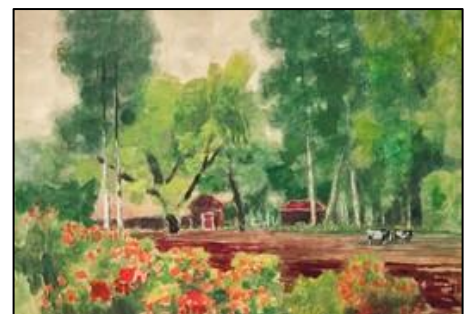
内藤 秀因《新坂平 白樺牧場》1970年