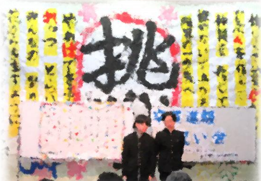
「大勢の前で、自分の考えを発表できました」

合わせ欠けている点は、これからの学校生活で身に付けていくこと。その為に今何をすべきかは生徒自身が考えて積み上げます。ご家族の皆様からのアドバイスも宜しくお願いいたします。