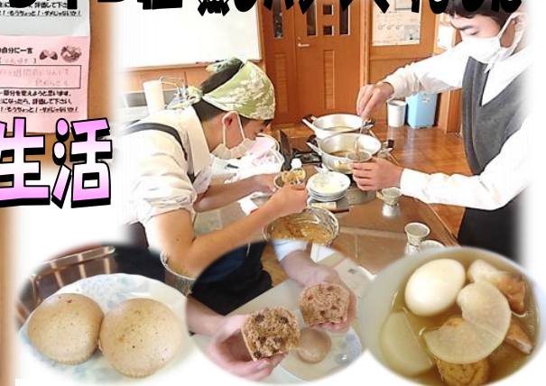
家庭科の様子です。蒸しパンやおでんを先生と一緒に作りました。味かげんも良く皆でおいしく頂きました。