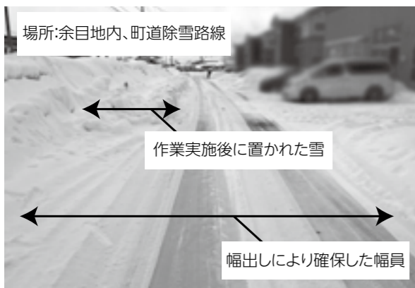
場所:余目地内、町道除雪路線 作業実施後に置かれた雪 幅出しにより確保した幅員 通行に支障のない幅員の確保に努めますが、このように幅出しなどの作業実施後に道路上への投雪が確認される場所があります。

歩行者が側溝に落ちるなど重大な事故につながりますので、必ず閉めてください。また、流雪溝で中ぶたのついている投雪口を利用する場合は、中ぶたは外さないでください。