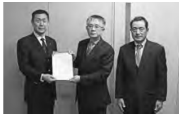
教育長へ答申書が提出されました