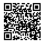
▲動画はQRコードからご覧ください。(町公式YouTubeにリンクしています)