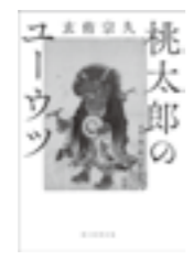
【桃太郎のユーウツ】

額賀 滯 小学館 新米駅伝監督・成竹と学生ナンバーワンランナー神原は、戦時下に箱根駅伝開催に尽力したとある大学生の日記を受け取った。箱根を走ることに命を賭けて挑み散っていった青年たちの熱い想い、青春を令和の現代と交錯させて描く。