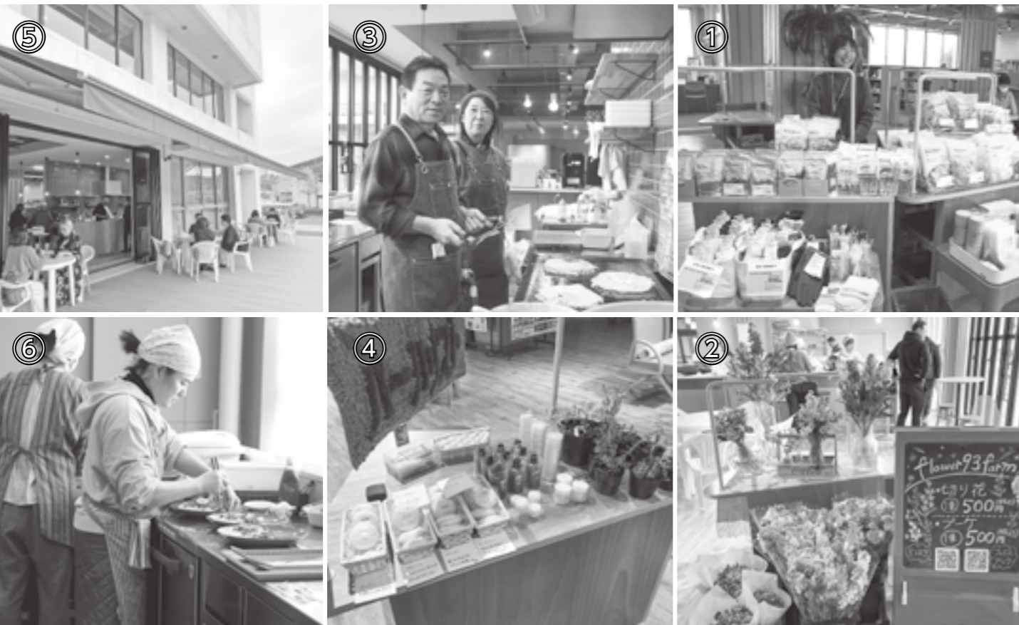
① 無印良品さん移動販売 ② flower93farmさん ③ 広島風お好み焼きのトゲヤマさん ④ ハーバリストさん ⑤ 天気の良い日はオープンテラスで開放的に ⑥ 晶芯道さんとオルファさんのコラボカフェは大人気。お2人で手際よく連携プレー

昨年7月オープンした立川複合拠点施設。小さな厨房やオープンフロアを利用して出店してくれる方たちが続々増えていて、新たな賑わいの場となっています。どんどんつながる出店者さんたちのご縁。面白いことをしている場所には自然と人が集まります。みなさんもぜひ遊びに来てください。新しいご縁が生まれるかもしれません。