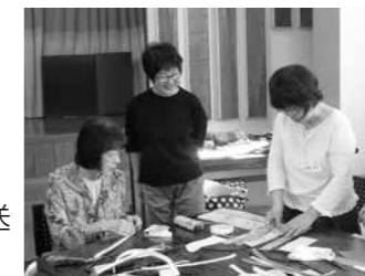
清川ライフアップセミナー