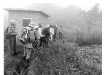
やまゆりスクール