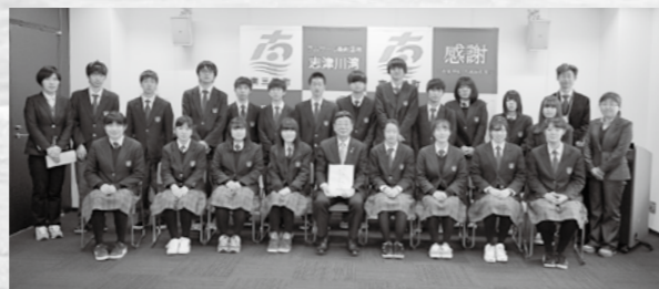
庄内総合高等学校のみなさんからの御寄附は、昨年度に引き続き3回目となります。みなさんの厚いお気持ちありがとうございます。大切にさせていただきます。