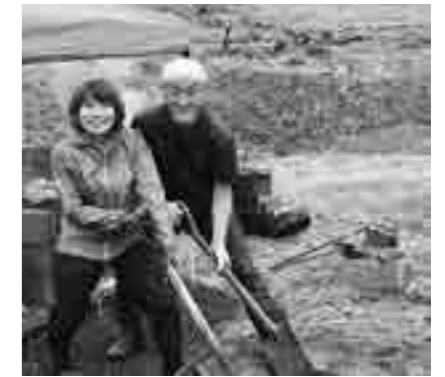
セメントを練って基礎から作ったピザ窯づくりは一生の思い出。