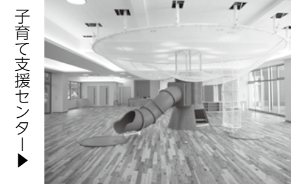
子育て支援センター

2階の連絡通路で、A棟とB棟がつながっています。A棟とB棟との間に活動とにぎわいの中心広場で、屋根のある「なかにわ」があります。