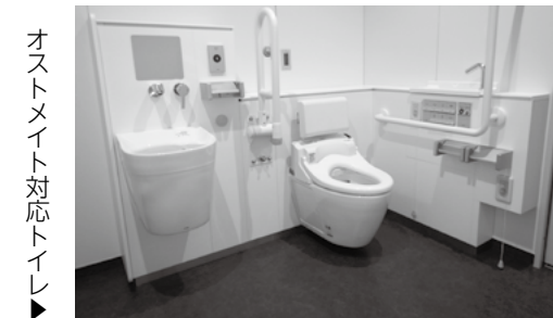
オストメイト対応トイレ