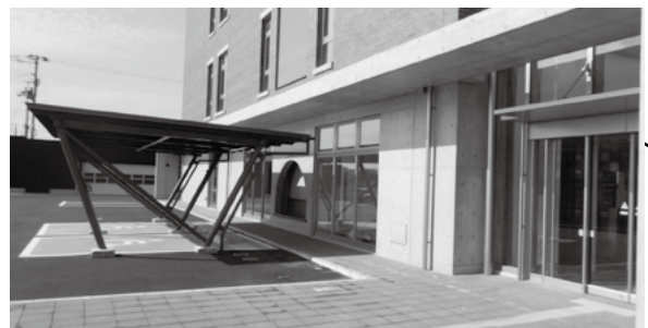
おもむきの駐車場

町民利用の多い窓口を1～2階にあつめました。1階は戸籍届出、証明発行、税、国保、介護、福祉、健康、保育、子育て。2階に農業、林業、住宅、道路、学校、文化、スポーツ。1階と2階がロビー階段でつながっています。