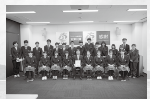
▲昨年の寄附金贈呈式の様子

3月18日(水)、山形県立庄内総合高等学校から、本町に寄附金を頂戴しました。 庄内総合高等学校とは、庄内町と南三陸町が友好町という縁で、2012年から志津川高校と交流活動が行われていますが、新型コロナウイルス感染拡大の現状に鑑み、今回はあえなく断念となりました。 庄内総合高等学校のみなさんからのご寄附は、昨年度に引き続き4回目となります。本町では今年度より、庄内町との交流事業を推進するべく、助成金を新たに創設しました。一日も早く事態が収束し、また交流できることを楽しみにしています。みなさんの心温まるご支援に感謝します。