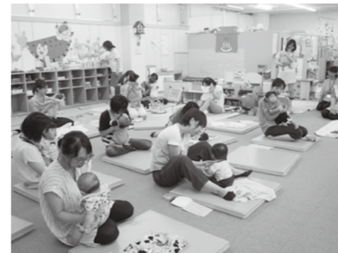
▲0歳のひろばの様子