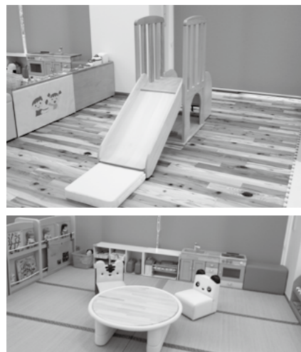
▲小さい子コーナー