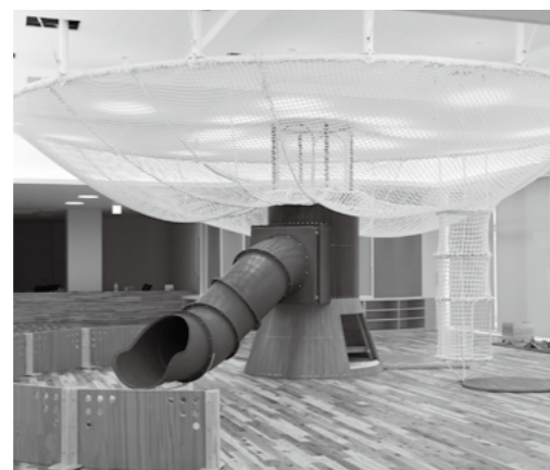
▲ネット遊具 ※6歳以上が対象です。