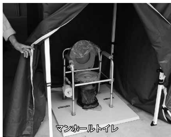
マンホールトイレ

5月18日に開庁した新・庄内町役場。旧庁舎は昭和36年に建てられ、耐震基準を満たしていませんでした。そのため、災害が起きた場合は立川総合支所で対策本部が立ち上げられていました。このたびは庁議室を配置し、災害時には対策本部に転用できるようにしました。さらに、防災無線室も新たに設置。新庁舎に防災拠点をもとめたことで、安全で迅速な対応が可能となりました。