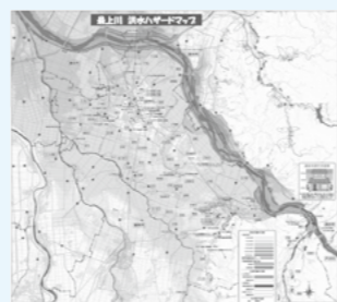
最上川洪水ハザードマップ