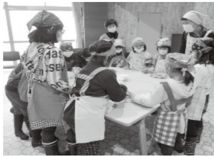
放課後子ども教室