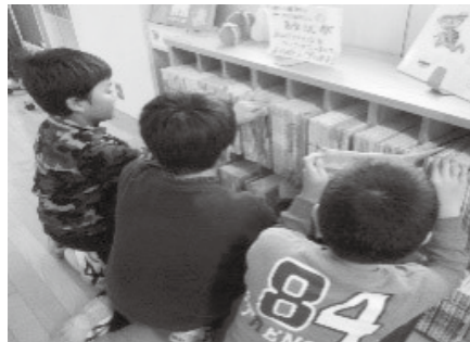
学校図書館の支援