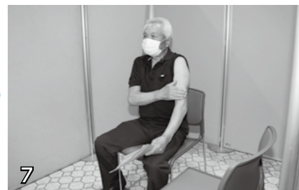
▲接種前準備(肩だし)。上腕に接種します。肩を出せる服装でおいでください。