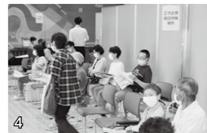
▲予診票確認待機場所。予診票の確認で番号を呼ばれるまで、こちらでお待ちください。