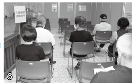
▲接種前待機場所。心を落ち着けて接種を待ちましょう。