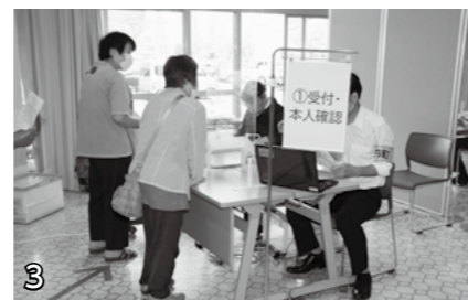
▲受付・本人確認。予防接種券・本人確認用の身分証明書(運転免許証、健康保険証、マイナンバーカード等)で本人確認します。