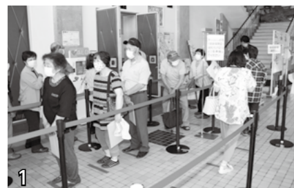
▲予約時間になると案内します。整列の上準備をお願いします。(予約時間にならないと入場できません)