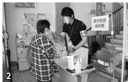
▲受付前感染対策。検温、手指消毒を行います。(必ずマスクを着用してください)