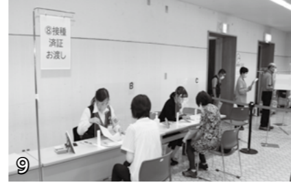
▲接種済証発行場所。新型コロナワクチンの接種済証を発行します。接種済証は大切に保管してください。