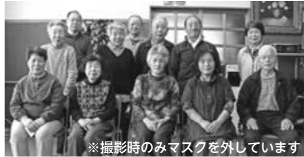
※撮影時のみマスクを外しています