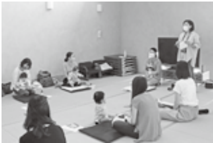
▲自身の子育ての経験を活かし「ベビーマッサージ教室 in 町湯」を開催

退任後はこれまでの経験を活かして、主に企業向けのマーケティングやPR支援の仕事をしていきます。引き続き庄内町におりますので、何かの際はお気軽にお声掛けいただけたら嬉しいです。今後とも末長くよろしくお願ひします。