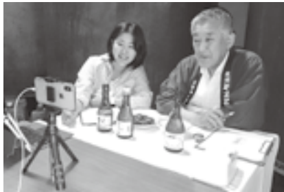
▲コロナ禍での新しい取り組み 全国の人とつながるオンラインツアー