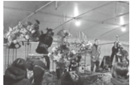
▲大盛況の「フラワーコンサート in the ビニールハウス」