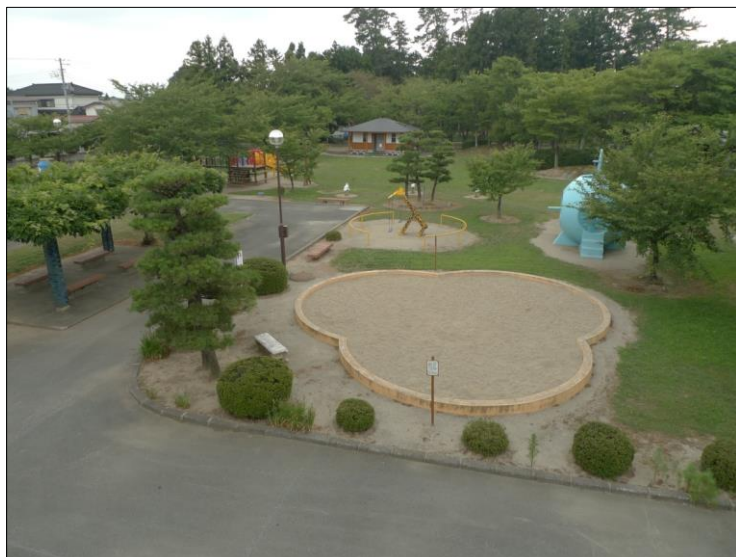
「八幡公園(遊具広場)」