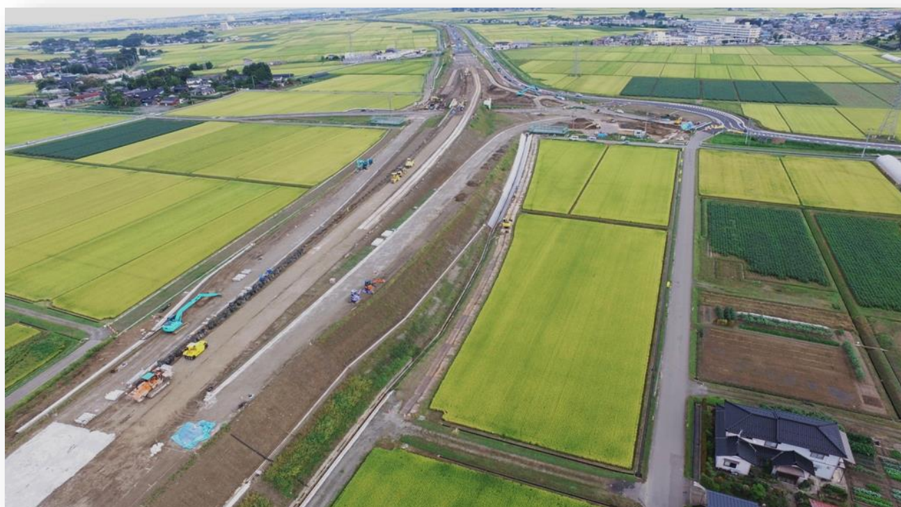
自動車専用道路「酒田余目線」