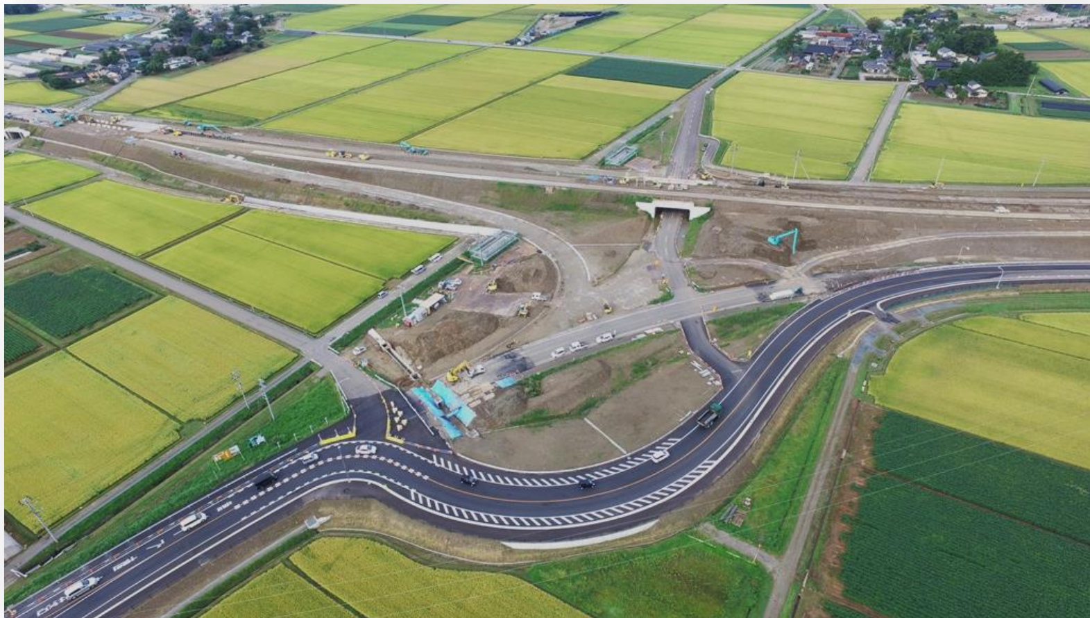
「3・4・2余目新田跡線(R47)及び1・3・1酒田余目線余目IC予定地」