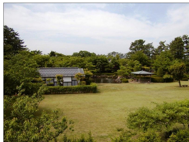
「八幡公園(庭園、茶室菁莪庵)」