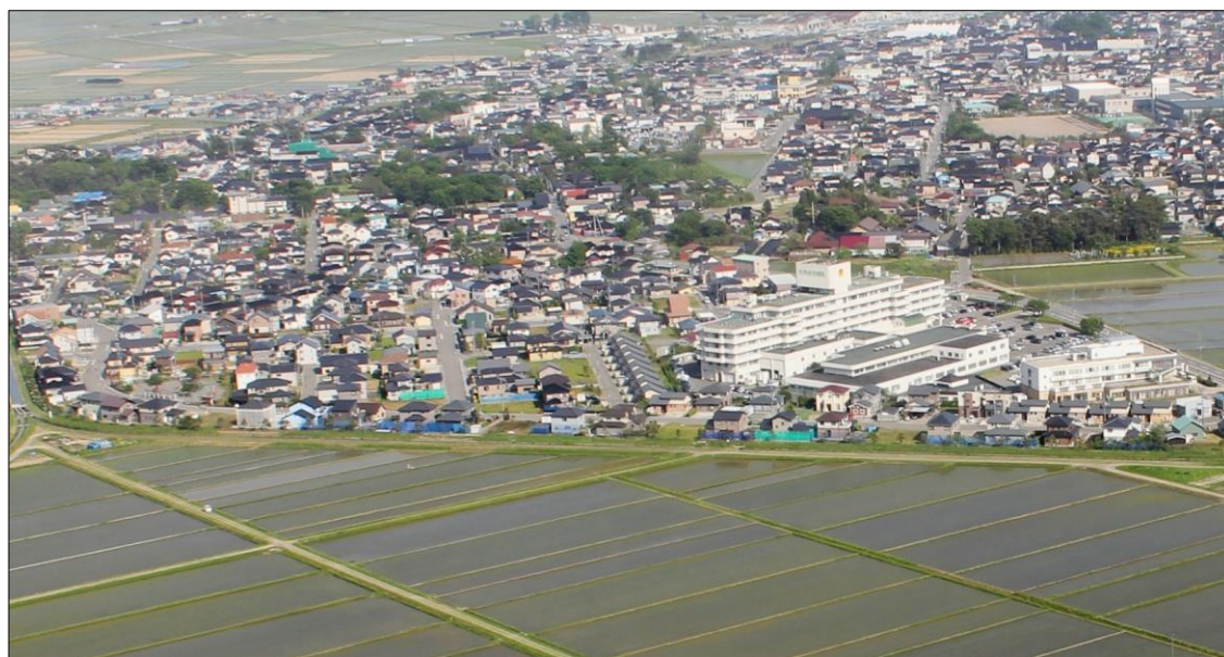
「松陽ニュータウン宅地開発」