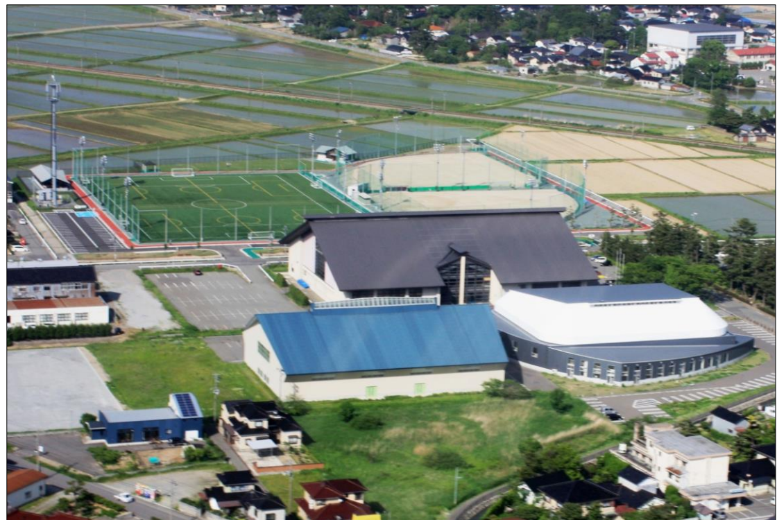
「八幡スポーツ公園開発」