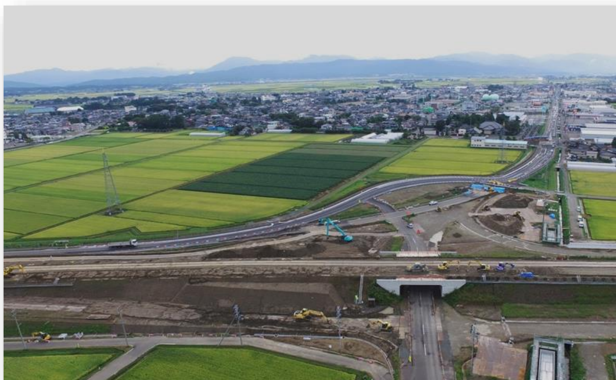
自動車専用道路「酒田余目線」余目 I C 付近