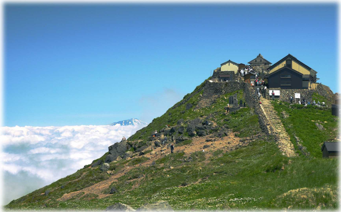
★霊峰・月山山頂と、雲海から垣間見える鳥海山

豊かな自然を誇る町、再生可能エネルギー・省エネルギーの先進地として、内外に誇りうる循環型の持続可能なまちづくりをさらに進め、未来へつないでいくため、『環境共生』をテーマに、再生可能エネルギーの利活用や環境衛生等に向けた取り組みを重点的に推進します。