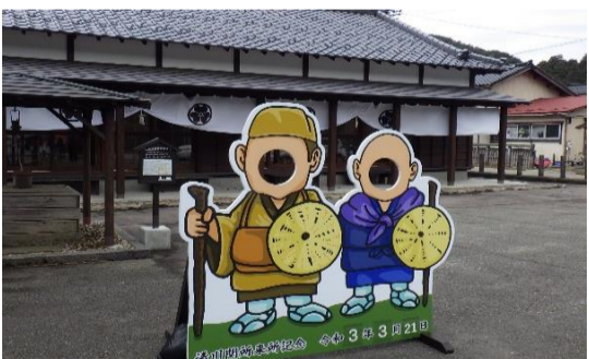
顔はめパネル活躍中！(芭蕉と曾良)