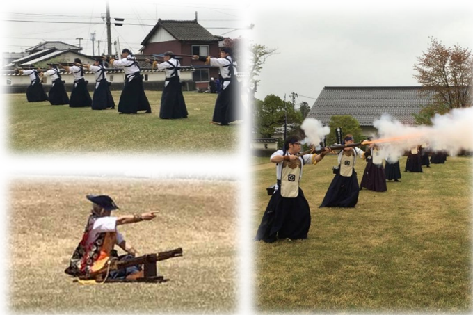
羽州庄内松山藩荻野流砲術隊 Facebook より

荻野流砲術は、所作・礼法・型を重視する流派です。戊辰戦争で松山藩と庄内藩は各地で勝利を収めました。新式の武器を多くそろえていたことに加え、荻野流砲術が果たした役割も大きかったと言われています。当日は、隊員の動きがそつた所作の美しさをぜひご覧ください。