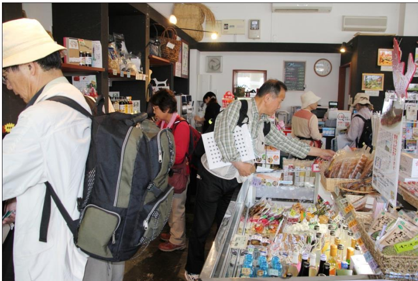
出発前(ホッとホーム)