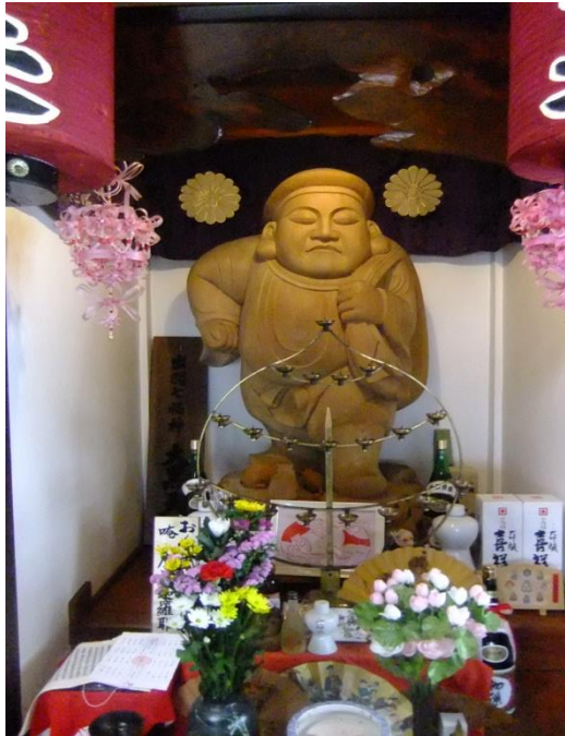
出羽七福神 立ち大黒天(冷岩寺)