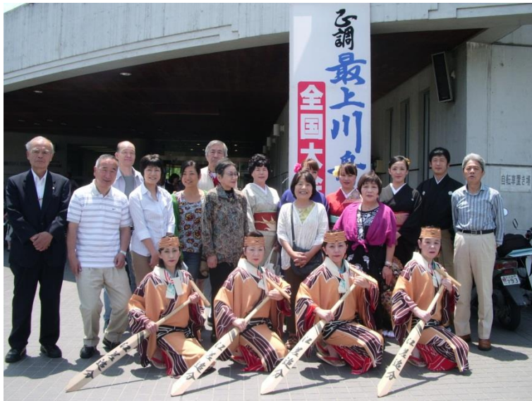
特別出演 江差追分