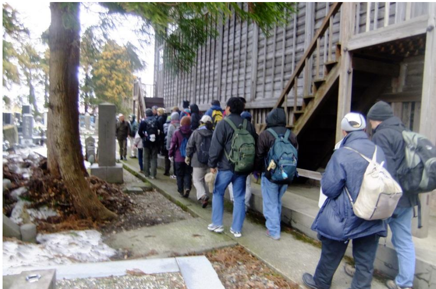
県指定文化財 北館大学墓(見龍寺)