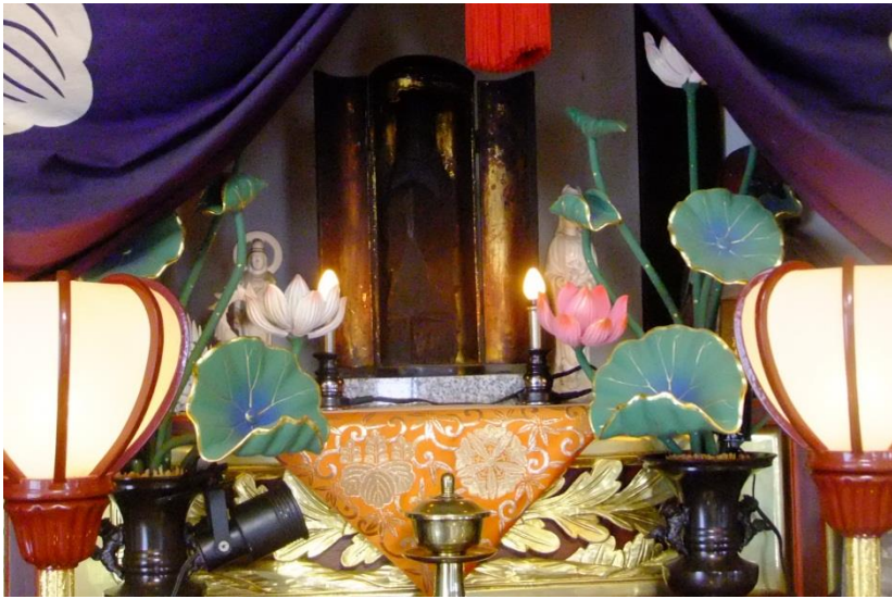
町指定文化財 円空 作 木造観音菩薩立像(見政寺)