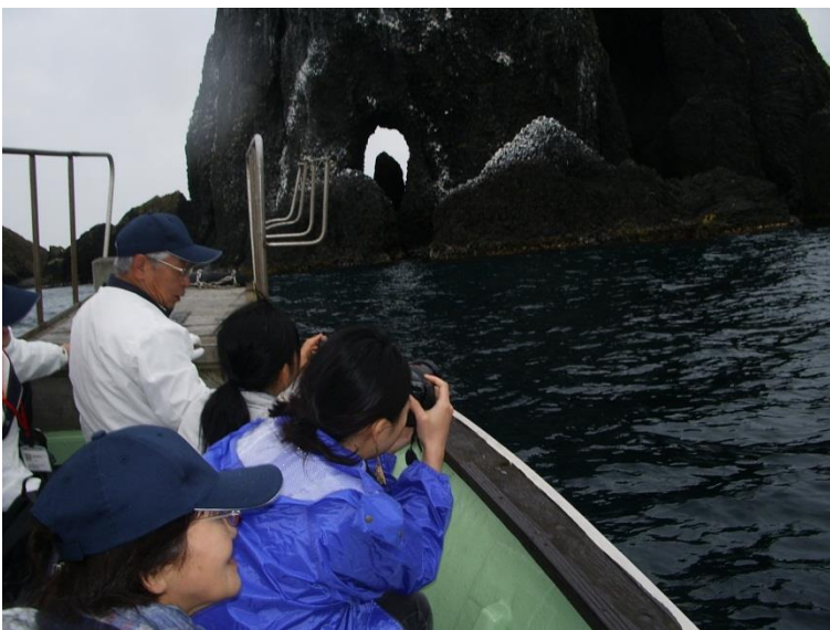
漁船で烏帽子群島研修