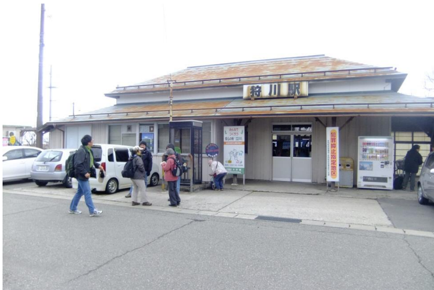
集合時間前(狩川駅)