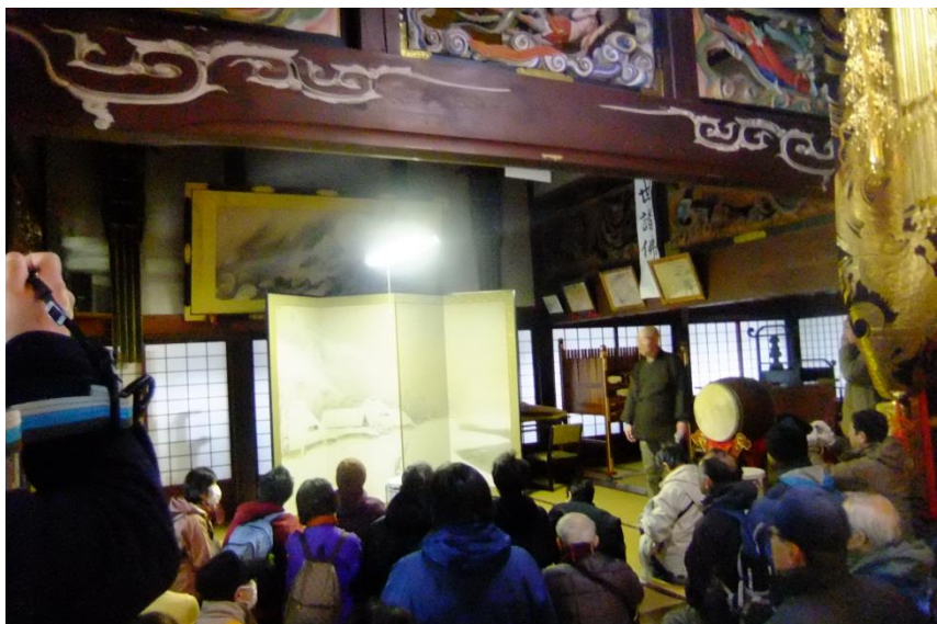
町指定文化財 雪景の図屏風(見龍寺)