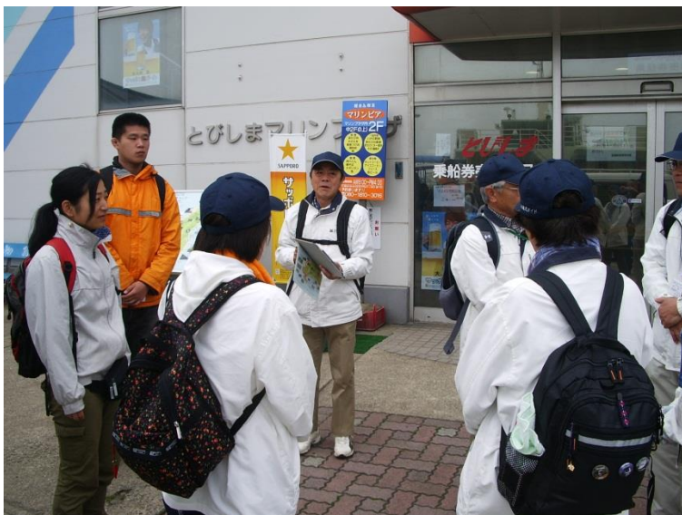
勝浦港 マリンプラザ前