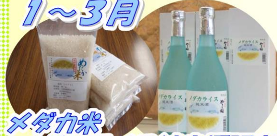
メダカ米 メダカライス純米酒販売