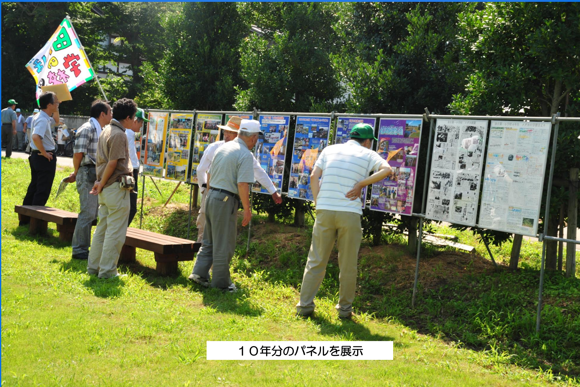
10年分のパネルを展示