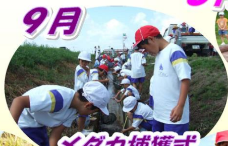
メダカ捕獲式 魚の学習会