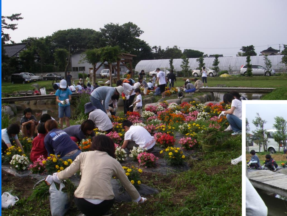
植栽と草取り作業