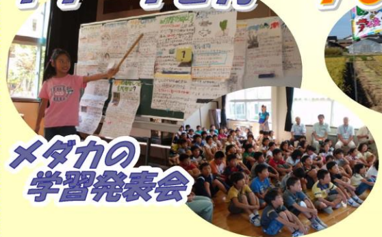
メダカの 学習発表会