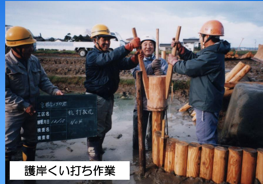
護岸くい打ち作業