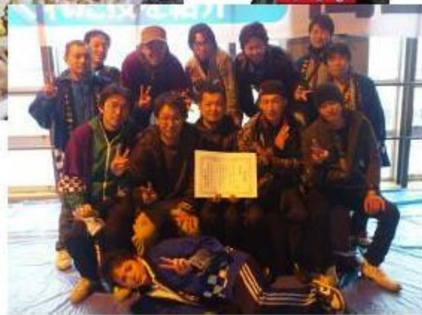
庄内町商工会青年部