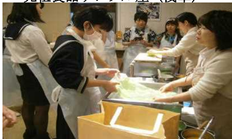
元祖食品サンプル屋（浅草）