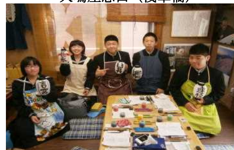
大嶋屋恩田（浅草橋）